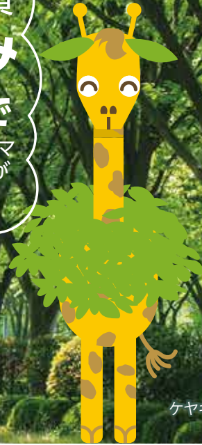
ケヤキリン 米子ケヤキ通り振興会 マスコットキャラクター