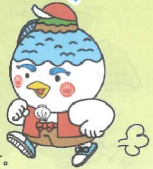
湖山池マスコット「こいけちゃん」