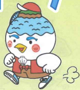
湖山池マスコット「こいちゃん」