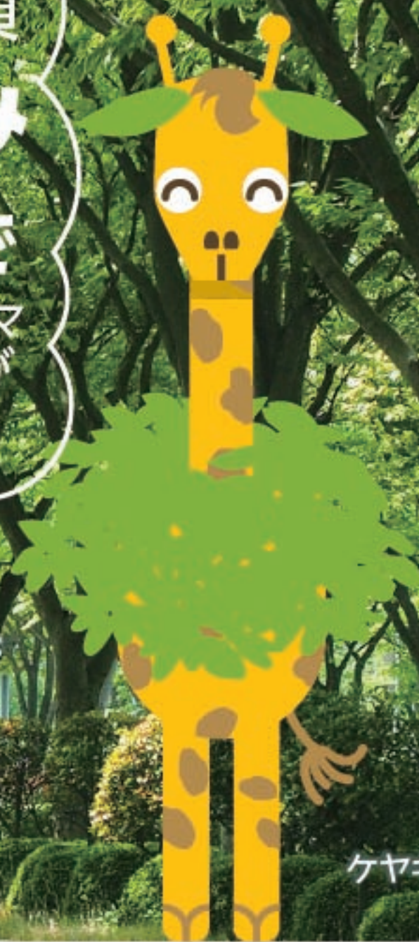
ケヤキリン 米子ケヤキ通り振興会 マスコットキャラクター