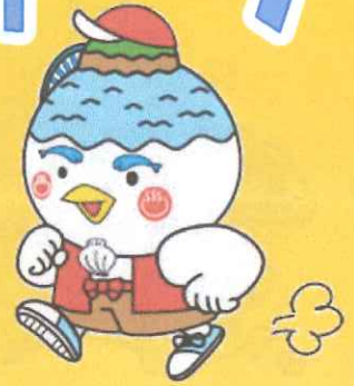
湖山池マスコット「こいけちゃん」

受付8:30～ 開会式9:15～ スタート9:30～(14:00終了予定) ※ゴール後随時解散となります。