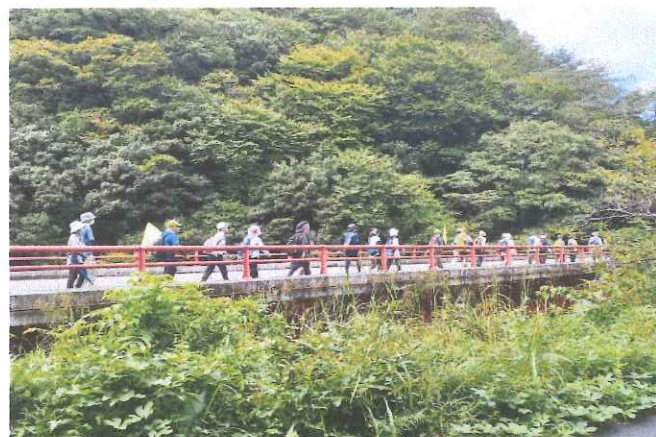
2022年日南町例会にて石霞溪へ