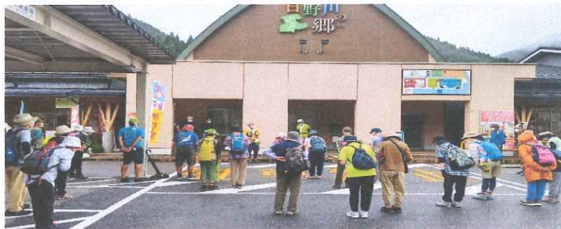
2022年日南町例会にて

日南町産のブランドトマト「日南トマト」 寒暖の差が大きい環境で育つから、甘みと旨みがぎっしり！ 大小の奇岩の間を走る水流。溪谷に沿って屏風のように連なる山肌。南北 2kmにわたる大溪谷は、奇岩や怪岩が目を引き男性的な「南石霞溪」と、 ゆるやかで女性的な「北石霞溪」に分かれています。