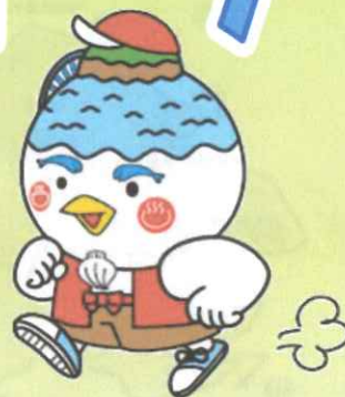
湖山池マスコット「こいけちゃん」