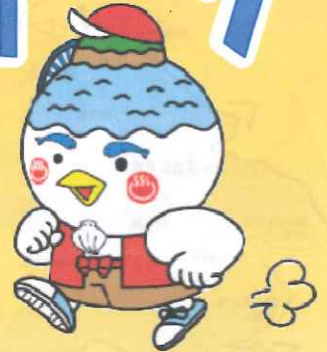
湖山池マスコット「こいけちゃん」