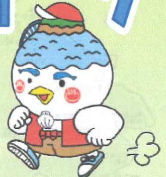
湖山池マスコット「こいけちゃん」