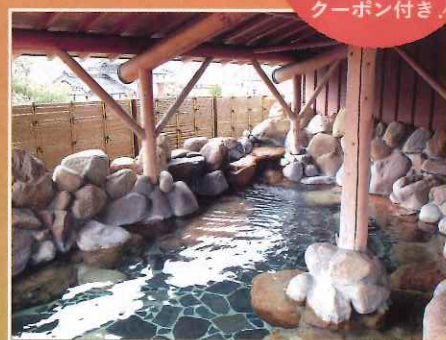
ゴール後は関金の温泉と美味しい地元ランチを満喫！