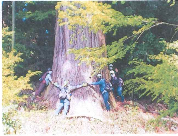
豊乗寺裏山の周囲約8mの杉の大木