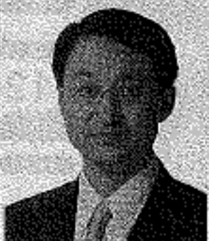
平井伸治 鳥取県知事