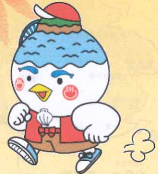
湖山池マスコット「こいけちゃん」