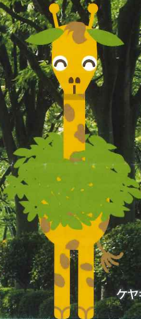
ケヤキリン 米子ケヤキ通り振興会 マスコットキャラクター

眼前に広がる秀峰大山と 美保湾を眺めながら、 新緑溢れるけやき通りを みんなで歩こう