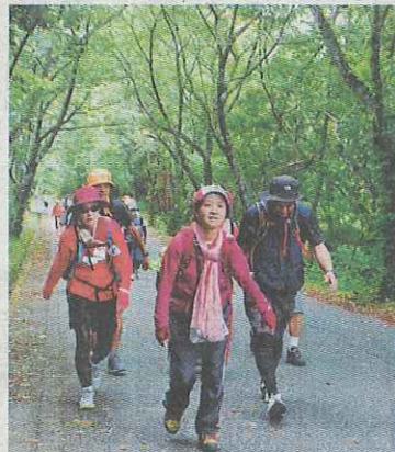
緑のトンネルを歩く参加者＝昨年の様子

園(5キ)=同▽歩育(3キ)=同 ◆参加費 一般事前申し込み1500円(当日2千円)。1日参加、2日参加とも同額。高校生以下は無料。