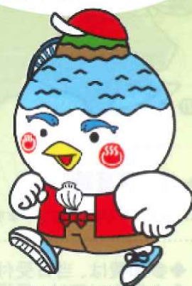
湖山池マスコット「こいけちゃん」