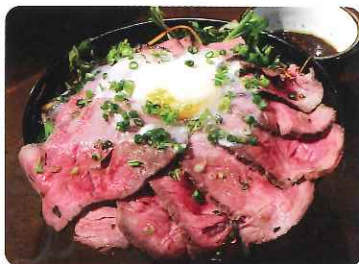
ローストビーフ丼@もぐら屋