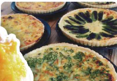
キッシュ@ひよこのお鍋

湖山池周りのグランピングスペースではドリンクやフード等を購入して味わうことができます! 参加者全員にはグランピングスペースで使える400円分の「おもてなし利用券」をプレゼント♪ (※1 下写真はイメージです。 / ※2 グランピング OPEN 8:30、CLOSE 15:00)