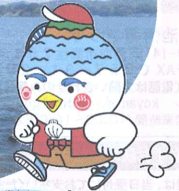
湖山池マスコット「こいけちゃん」