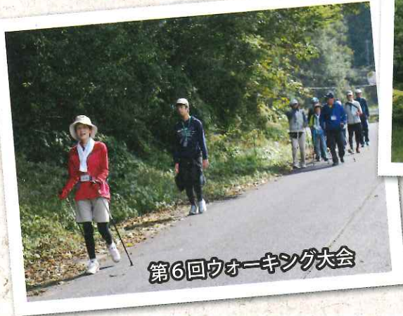
第6回ウォーキング大会