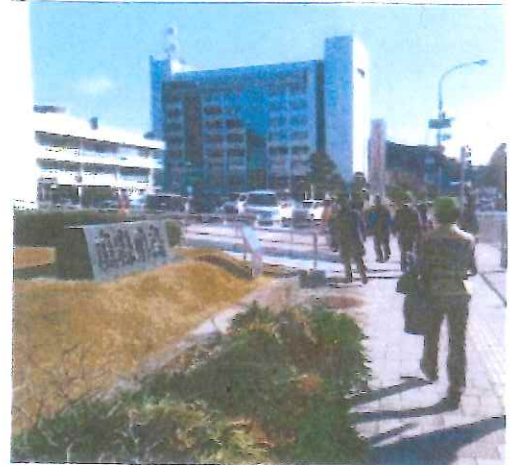
鳥取県庁をスタート

コース 鳥取県庁⇒29号線⇒鳥取県東部庁舎⇒あおば地区公民館⇒奥谷入口⇒宇部神社⇒立川大橋⇒大雲院⇒広徳寺⇒鳥取東照宮(禰道神社)⇒県知事公舎⇒県庁駐車場(道路事情等でコース変更をする場合がありますので、予めご了承願います)