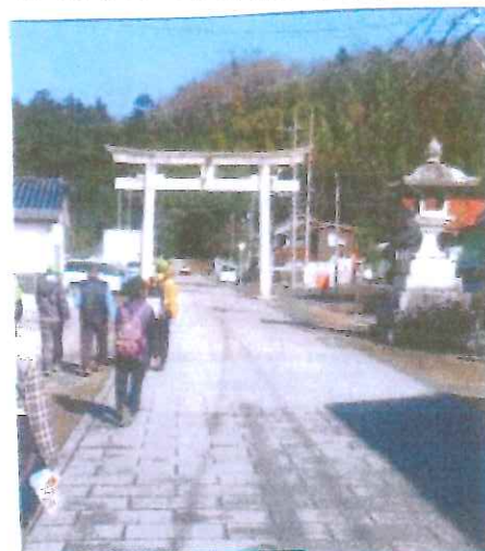
宇部神社への参道

※ゴール予定は13時頃になっていますが、交通事情等にて予定時間を超えることが予想されますので、列詰め休憩等にて食べれる軽食の持参をお願い致します。