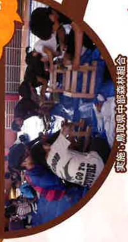
実施は鳥取県中部森林組合