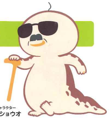
日南町公式キャラクター オッサンショウオ