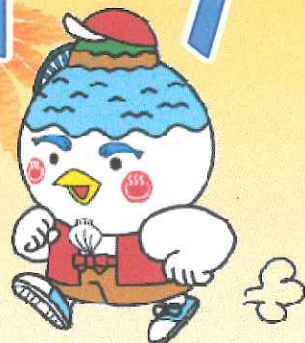
湖山池マスコット「こいけちゃん」