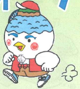
湖山池マスコット「こいけちゃん」

集合場所 湖山池情報プラザ (鳥取市高住754-17) ※駐車場あります(約200台)