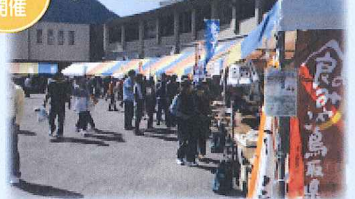
日南町のおいしいものが大集合!!