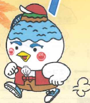
湖山池マスコット「こいけちゃん」