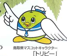
鳥取県マスコットキャラクター「トリピー」

ウォークの後は、昨年大山寺参道沿いにオープンした温泉施設「大山火の神岳温泉豪円湯院」にて大山の地下より湧き出た温泉「神の湯」をお楽しみください。