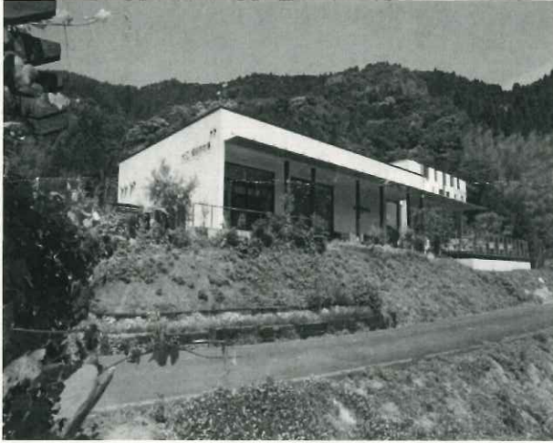
大江ノ郷自然牧場

八頭町にある名所や店舗を巡りながら、ウォーキングを行う。ぷらっとぴあ・やず→大江ノ郷自然牧場→船岡竹林公園→隼駅が主なルート。帰りは、若桜鉄道を利用し、郡家駅まで戻る。隼駅で終わりの会（鳥取まで若桜鉄道を利用される方のため）を行い 16時に解散予定。