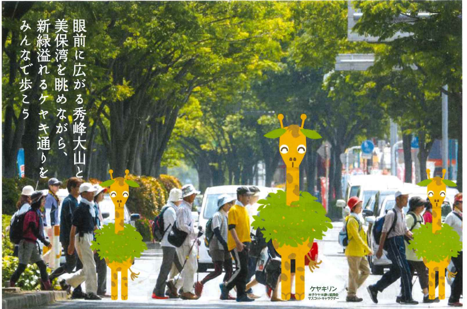
ケヤキリン 米子ケヤキ通り振興会 マスコットキャラクター

眼前に広がる秀峰大山と 美保湾を眺めながら、 新緑溢れるケヤキ通りを みんなて歩こう