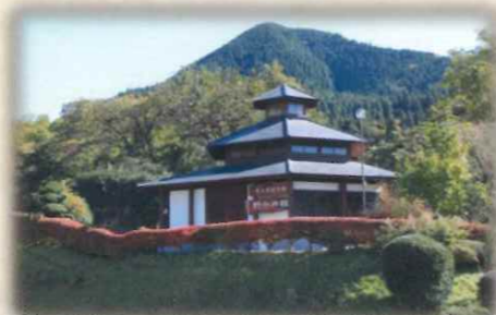
井上靖記念館（野分の館）