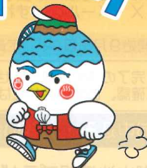
湖山池マスコット「こいけちゃん」