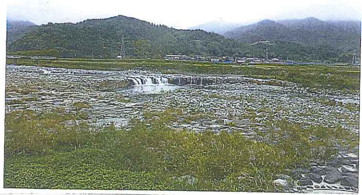
徳丸どんと(ナイヤガラの滝)