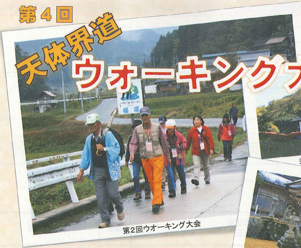
第2回ウォーキング大会