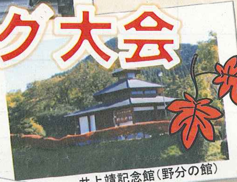
井上靖記念館(野分の館)