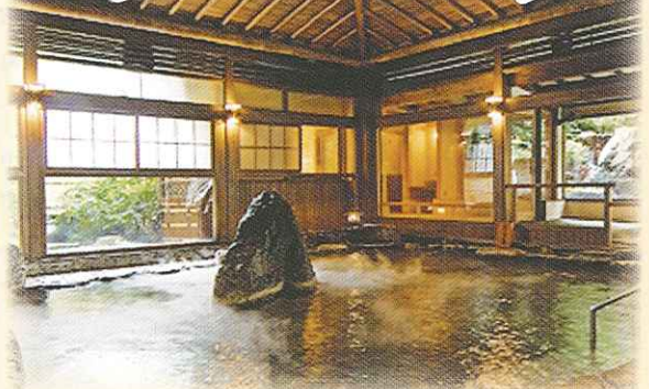
写真は「依山楼 岩崎」の大浴場

《秋のみちくさウォークについてのお問い合わせ・申し込み先》 三朝町健康福祉課 TEL.0858-43-3520(直通) FAX.0858-43-0647