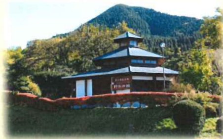
井上靖記念館(野分の館)