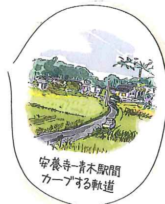
安養寺-青木駅間 カーブする軌道